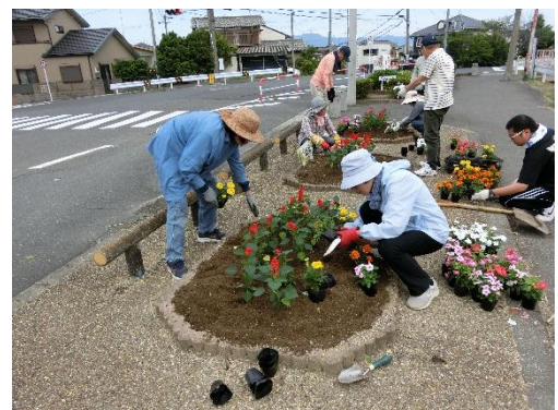
まち角潤い事業 花いっぱい運動