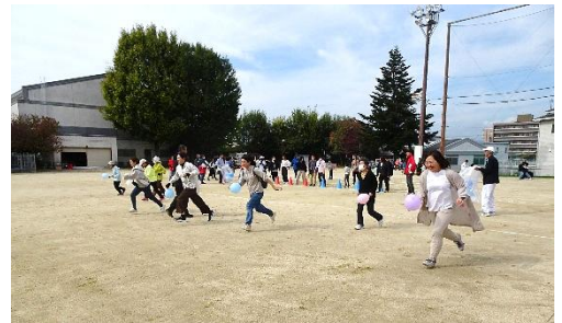
学区運動会(南笠東小学校)