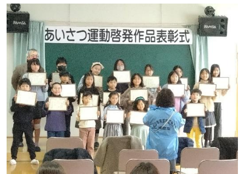
あいさつ運動啓発作品表彰式