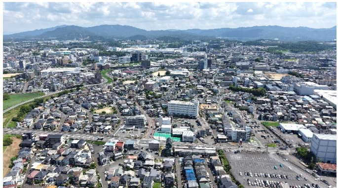
学区の眺望(笠山2丁目より)

また、学区に隣接して立命館大学（BKU）や滋賀医科大学、龍谷大学があり、多くの学生が区域に居住していることも、まちの特徴の一つとなっています。南西のエリアには県立の図書館、美術館など滋賀県が提唱する「びわこ文化公園都市」が広がります。