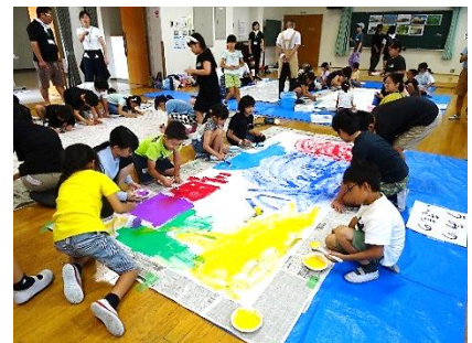
わんぱくプラザ事業