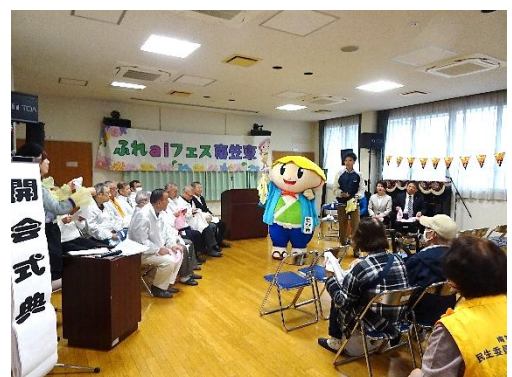
ふれあいフェス南笠東