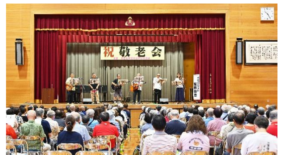
学区敬老会(南笠東小学校)