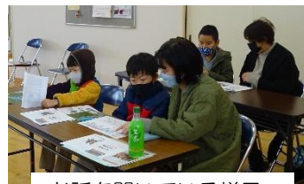
お話を聞いている様子

子ども達は、お城にはどんな武将がいたのか、どんなお城だったのかを興味深く聞いていました。