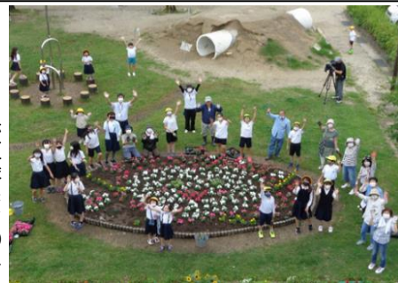
みな小おうえんたいのみなさんと 環境委員会の子どもたち

日頃から、たくさんの地域の方々に『みな小おうえんたい』として本校の教育活動を支援していただき、心より感謝申し上げます。校庭の花壇整備、さつまいも植え、校外活動や学習の支援…子どもたちも地域の皆さまにご来校いただくのを楽しみにしています。そして、何よりもうれしいのは、地域の皆さまとの『つながり』の中で子どもたちが伸び伸びと育っていることです。これからも、ご支援・ご協力の程、どうぞよろしくお願いいたします。