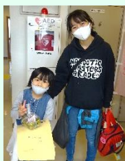
プレゼントを もらって にっこり♡