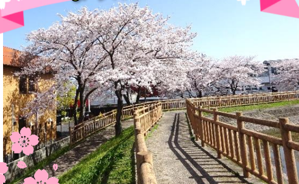
弁天池のソメイヨシノ

南笠東学区まちづくり協議会では、地域の魅力を発掘し、日常生活に潤いを与える「まち角潤い事業」に取り組んでいます。昨年11月には、わおんの広場でのビオラ植えや、各町内会の協力で公園にビオラや葉ボタンを植えたフラワーポットを設置しました。春を迎え学区内でも桜が咲くスポットがいくつかあり、弁天池の散策路沿いのソメイヨシノは、地域ボランティアのお世話により学区内一のさくらの名所にもなっています。