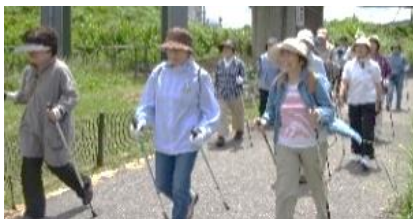
ポールを使ってウォーキング を楽しむ参加者の皆さん