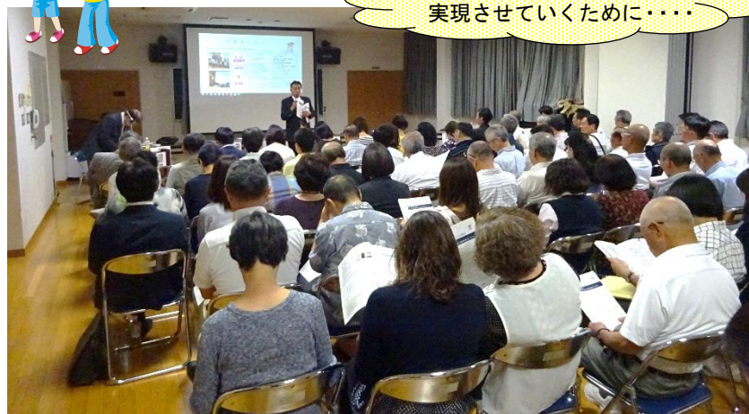
まちづくり出発式(総会)