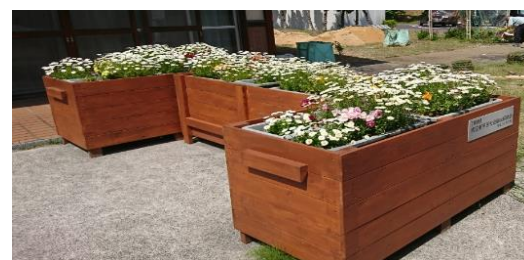
びわこ学園に寄贈した花壇