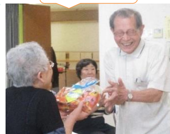
誕生日プレゼントを お渡ししています