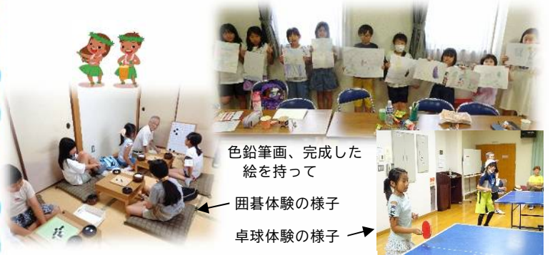
色鉛筆画、完成した絵を持って