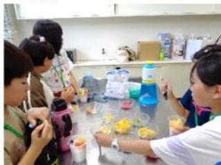
ボランティアさん手作りのひんやりデザート