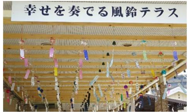
様々な手書きの風鈴が音を奏でます