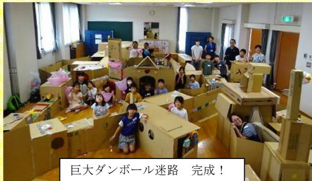
巨大ダンボール迷路 完成！

5日午後と6日午前、キンキダンボール（株）様に寄贈していただいたダンボールで巨大ダンボール迷路を作りました。初めて実施する事業で、子ども達もスタッフもワクワク！地域の方、保護者ボランティアにもご協力いただき、友達と協力しながら、設計図無しで大きな空間や狭いトンネル、タワーなどを繋げていき巨大な迷路を作りました。仕上げに、折り紙やセロファンで飾り付けをして完成！最後はみんなで思いっきり遊びました。