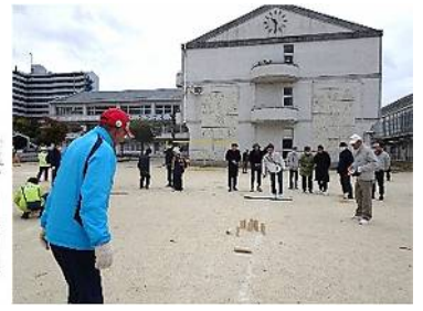
モルック大会の様子