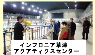
インフロニア草津アクアティクスセンター

12月10日(火)、14名が参加し自治連合会の研修を実施しました。初めの研修先インフロニア草津アクアティクスセンターは、全国でも最新設備であり水量を変えず50M プールを4分割でき、水深が0~3mまで自在に調整可能な機能があります。また、監視員がおられ、他のスタッフも巡回され安全面でも対応が行き届いていると感じました。2カ所目の研修先もりやまエコパーク環境センターは、周辺住民の意見を取り入れ、外部から煙突がほぼ見えない設計でイメージアップをされた施設でした。また、施設学習にも工夫配慮がなされ、市民にごみ分別の大切さとごみ廃棄の安全な取り組みなどが詳細に解かる展示がありました。ただ、草津市でも同様ですが、市民が間違った廃棄をすることは大変な処理動力(人労と税金)がかかること、大きな危険に繋がる可能性が大でありひとり一人がごみ廃棄には決められたことをしっかりと守ることが大切であることも実感した研修でした。エコパーク交流拠点は、