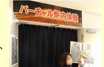
守山市環境センター研修の様子