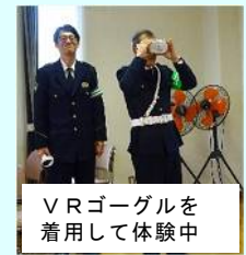
VRゴーグルを着用して体験中

最後に交通安全協会南笠東支部では、学区内での交通事故がなくなるよう啓発活動に取り組んでいることに対し、住民参加者の皆様のご理解とご協力をお願いして教室を終了しました。