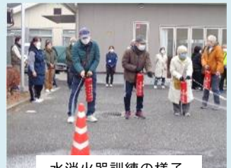
水消火器訓練の様子

その後、館内と外掃除を行いました。寒い中でしたが、皆さん丁寧に掃除していただき、気持ち良く過ごせるセンターとなりました。