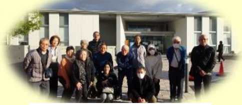
エコパーク交流拠点での記念撮影