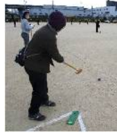
グラウンドゴルフ大会の様子

グラウンドゴルフは開始時間を早めたのですが、時間を勘違いされている参加者が多数おられました。告知方法を含め改善したいと思います。フィンランド発祥のモルックは各町内会のチームによるトーナメントを実施しました。5町揃って競技するのは久しぶりで熱戦が繰り広げられ盛り上がっていました。